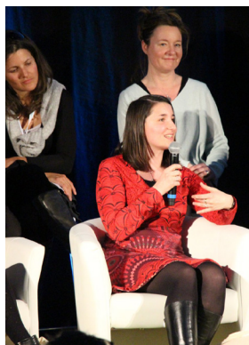
Table-ronde dédiée au management au féminin qui met en lumière des femmes remarquables et leurs carrières.